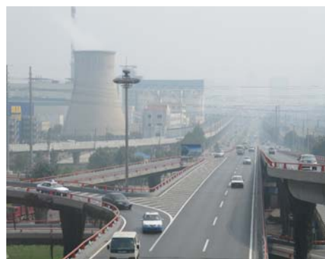
市内から大連開発区に向かう高速道路