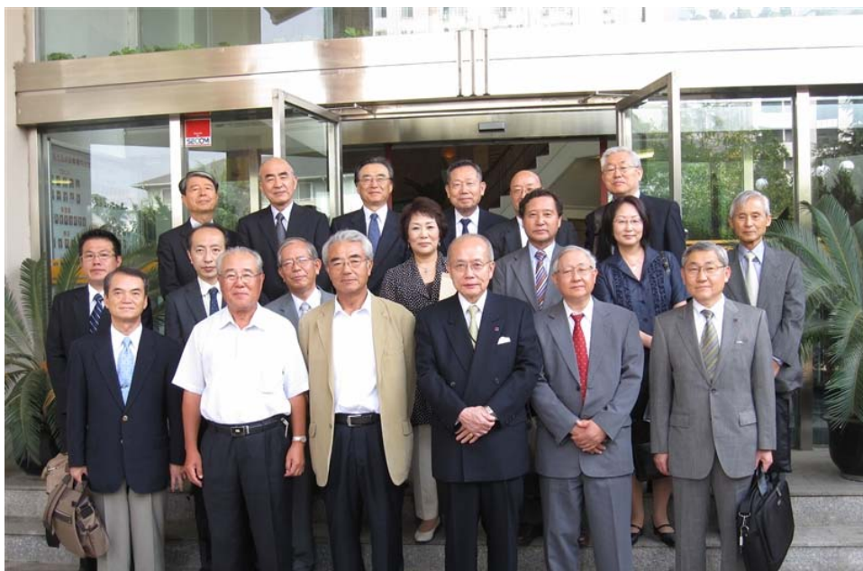
管理棟入り口で記念撮影

管理棟からさらに奥に向かって歩いて行くと、敷地の緑の中に住宅が見えてくる。非常にゆったりとした空間の中に日本的な機能や清潔感を感じさせる、落ち着いた住宅地で日本人が多く住んでいるのが良く理解できる。部屋の中も清掃が行き届いていて、住みやすそうであった。家族用に市内の日本人学校へのスクールバスや、ショッピングセンターなどを巡回するシャトルバスも用意されている。また、四季折々のイベント、お花見、リンゴ狩り、クリスマスパーティ、餅つきなども催されているとのことで、マネジメントの努力がうかがえる。数 10 年前の中国では、突然の政府幹部の出現などで出張者がホテルから追い出されるということがよくあったと聞いているが、まさに隔世の感である。