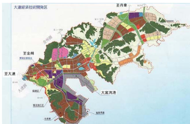
大連経済技術開発区全体図

現在、この工業団地では日系企業63社を中心に約80社の企業が操業している。この工業団地という言葉はもちろん日本で作られた名詞であるが、この時