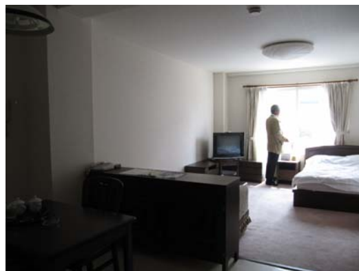
单身者用 42m2 内部

管理棟からさらに奥に向かって歩いて行くと、敷地の緑の中に住宅が見えてくる。非常にゆったりとした空間の中に日本的な機能や清潔感を感じさせる、落ち着いた住宅地で日本人が多く住んでいるのが良く理解できる。部屋の中も清掃が行き届いていて、住みやすそうであった。家族用に市内の日本人学校へのスクールバスや、ショッピングセンターなどを巡回するシャトルバスも用意されている。また、四季折々のイベント、お花見、リンゴ狩り、クリスマスパーティ、餅つきなども催されているとのことで、マネジメントの努力がうかがえる。数 10 年前の中国では、突然の政府幹部の出現などで出張者がホテルから追い出されるということがよくあったと聞いているが、まさに隔世の感である。