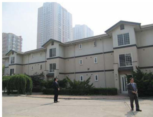
単身者用アパート式住宅